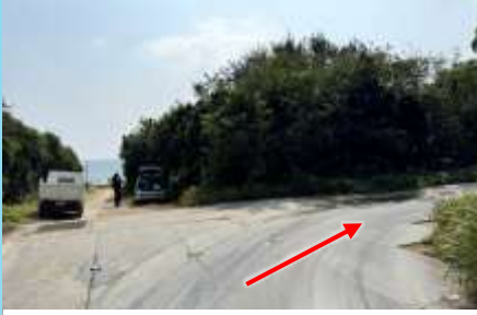
②さらに右道に入ります Take the right road further on.