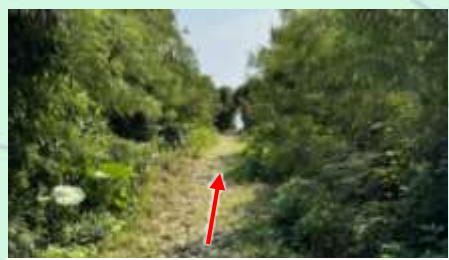
⑦ゴツゴツした道を進みます Continue on the stone path.