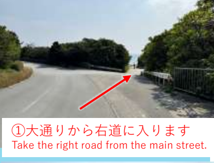
①大通りから右道に入ります Take the right road from the main street.