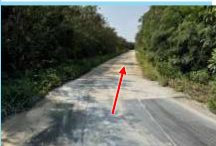
③砂利道になりますが進みます It will be a gravel road, but keep going.