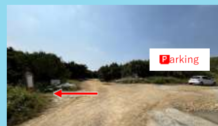
⑤左側に看板が見えてきます You will see a sign on the left.