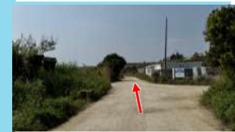
④さらに進みます Straight ahead.