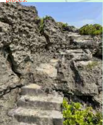
⑨階段を上ります Going up the stairs.