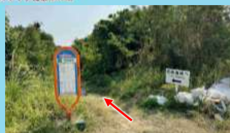
⑥徒歩で看板の先に進みます Continue on foot past the sign.